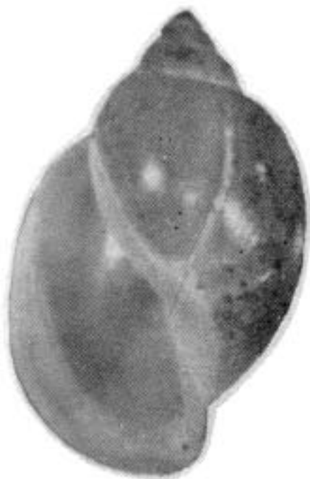
Fig. 3. Concha (altura: 12.6 mm) de Physella acuta , de Erivan (Armenia). Tomado de Akramowski (1976: lám. 2 fig. 23).

fía hemos encontrado representada otra concha de P. acuta (Fig. 3) procedente de Erivan (Akramowski, 1976: lám. 2 fig. 23), que tiene esbozado este tipo de crecimiento, aunque menos desarrollado: lo está sólo en una fase inicial. La presencia de dos conchas similares en lugares tan distantes como Canarias y Armenia respalda la posibilidad de que la concha del Parque García Sanabria pueda corresponder, en realidad, a la fase final del ciclo biológico de la especie. La ausencia de una descripción de esta fase anómala en la bibliografía sugiere que, de ser realmente la fase senil de su ciclo biológico, la mayoría de los ejemplares de P. acuta podrían morir antes de alcanzar este estado.